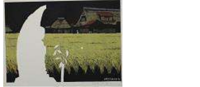
石仏の里(1972年・木版画)