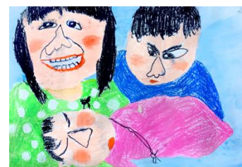
小学校1・2年生の部 金賞作品

ビュフェ美術館では、静岡県内の幼児から中学生を対象に毎年「夏休みの思い出」をテーマに作品を募集しています。今年の応募作品1912点の中から、入賞、入選作品263点を展示します。夏の思い出が詰まった作品をぜひ見てください。1月13日（土）から3月6日（火）まで開催しています。