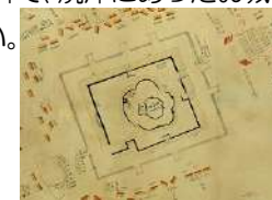
花沢城攻撃の武田氏陣形図

「お城」と聞くと、どのようなお城をイメージしますか？城跡から見つかったものや色々な資料で、焼津にあったお城を紹介しします。ぜひ見に来てください。