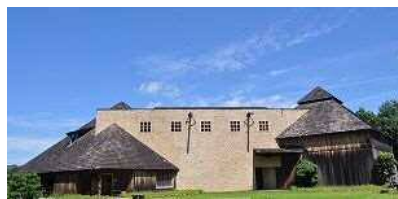
浜松市秋野不矩美術館 1998年

はままつしりつかものまぶちきねんかん 浜松市立賀茂真淵記念館 平成30年度平常展開催中