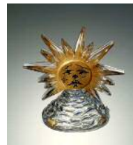
スクヤパレリ社「太陽王」1945年、バカラ