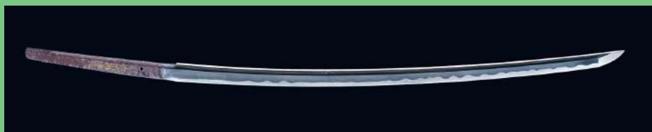
重要文化財 刀 金象嵌銘 備前国兼光/本阿弥(花押)〈名物 大兼光〉南北朝時代(14世紀) 佐野美術館蔵