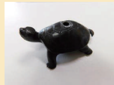
亀(かめ)の水滴(すいてき)